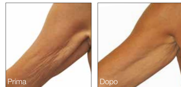
Risultati dopo 6 trattamenti