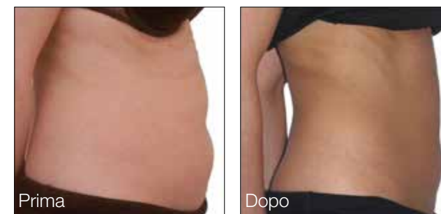
Risultati dopo 10 trattamenti