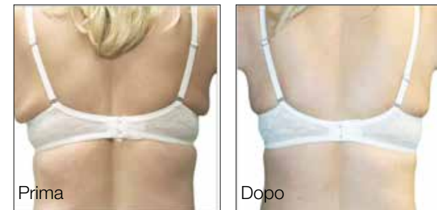
Risultati dopo 8 trattamenti